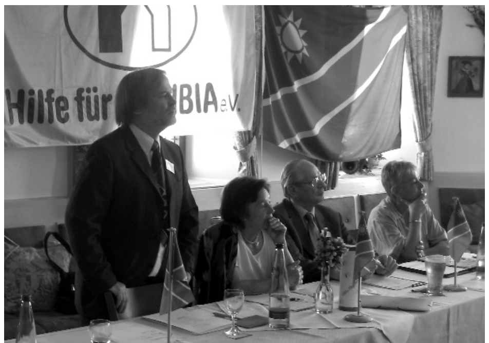
Der Vorstand von „Hilfe für Namibia e.V.“ wurde neu gewählt.