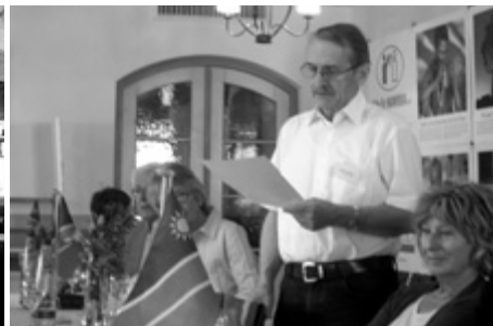
„Hilfe für Namibia e.V.“ Jahreshauptversammlung 2010 in Holzkirchen/München am 05. Juni 2010