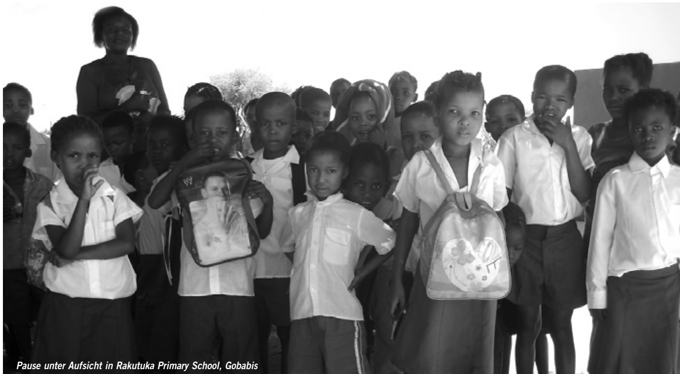
Pause unter Aufsicht in Rakutuka Primary School, Gobabis